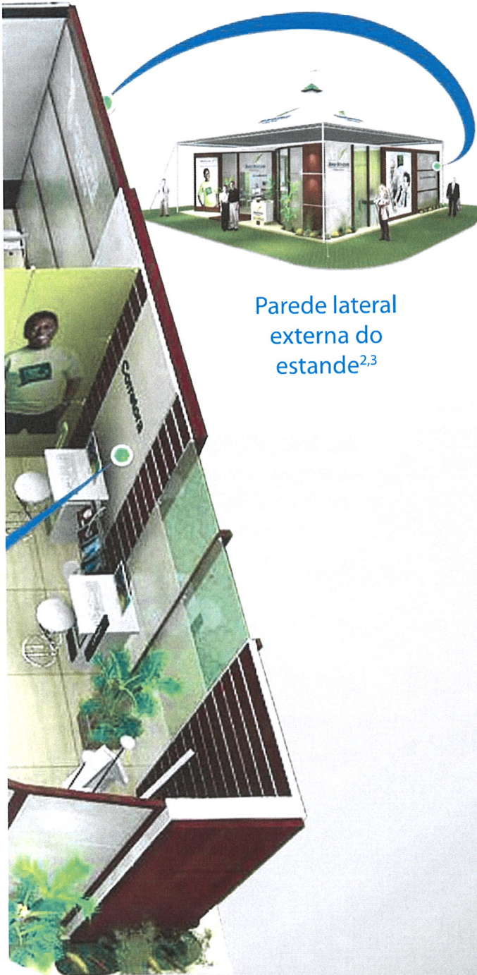
Parede lateral externa do estande 2,3