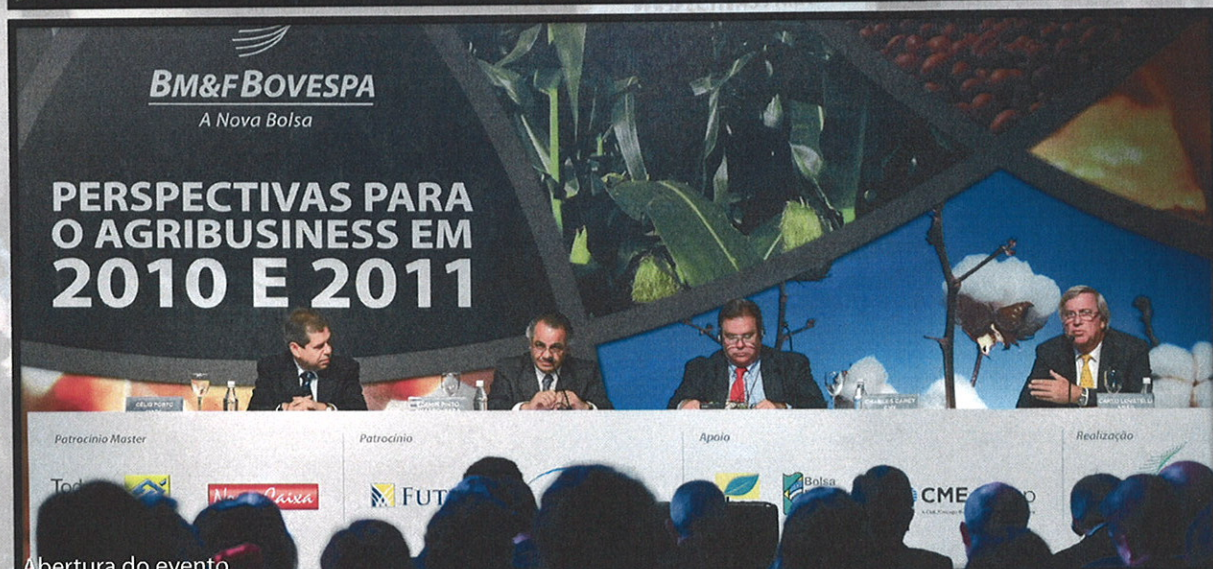
Abertura do evento