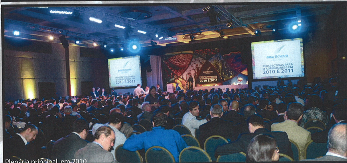
Plenária principal, em 2010