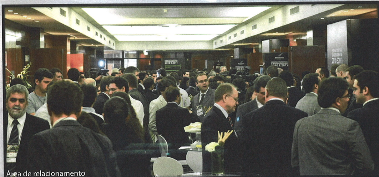
Área de relacionamento