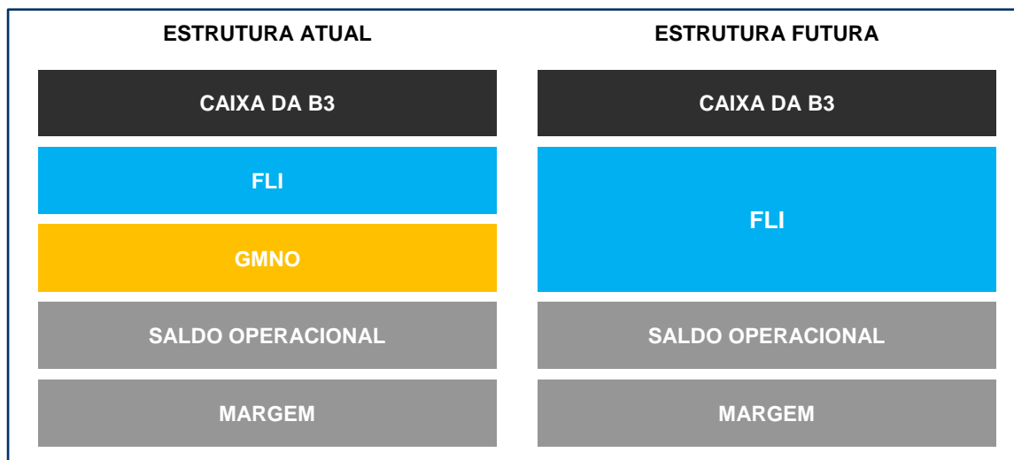
Figura 1 – Estruturas de salvaguardas atual e futura

A seguir, estão ilustrados os componentes da estrutura de salvaguardas atual e da futura estrutura resultante da conversão de GMNO em contribuição para o FLI (Figura 1), bem como as correspondentes sequências de utilização das garantias (Figura 2) em caso de inadimplência de MC com a devida identificação de inadimplentes em todos os níveis da cadeia de responsabilidades (comitente, participante de negociação e PNP ou PL).